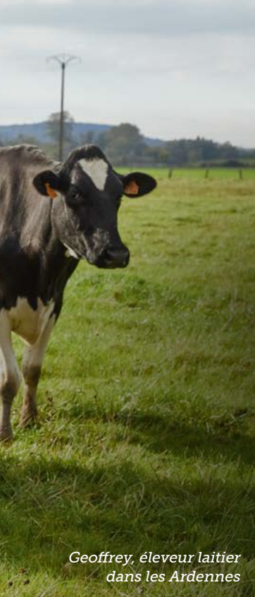
Geoffrey, éleveur laitier dans les Ardennes