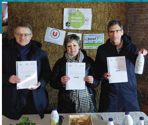
Signature du contrat lait U Bio avec Biolait et Laiterie de Saint-Denis de L'hôtel