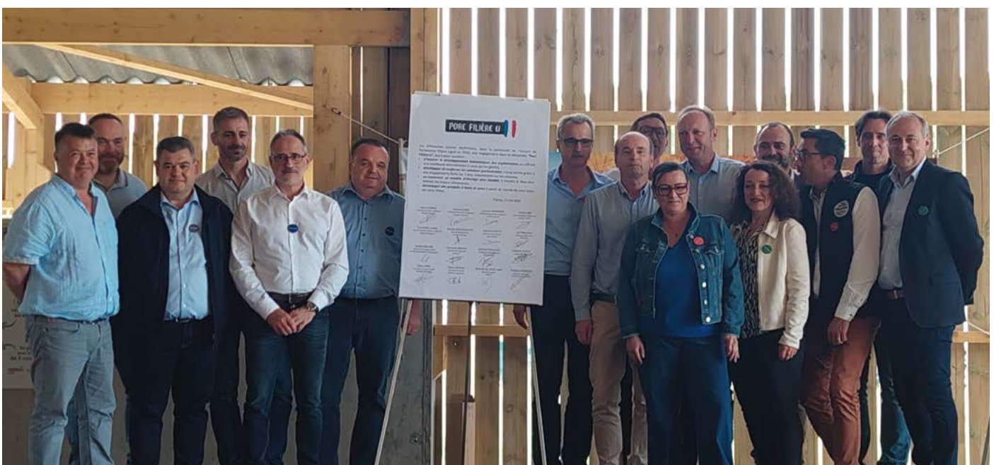
Représentants des coopératives, abatteurs, salaisonnières et magasins U, impliqués dans la Filière Porc U Confiance

En 2024, U a renouvelé son engagement auprès des éleveurs et abatteurs partenaires, augmentant les volumes abattus chaque semaine de 3 000 à 7 000 porcs. Cette montée en puissance permet à la filière de couvrir davantage de produits U, avec 46 références prévues pour 2025.